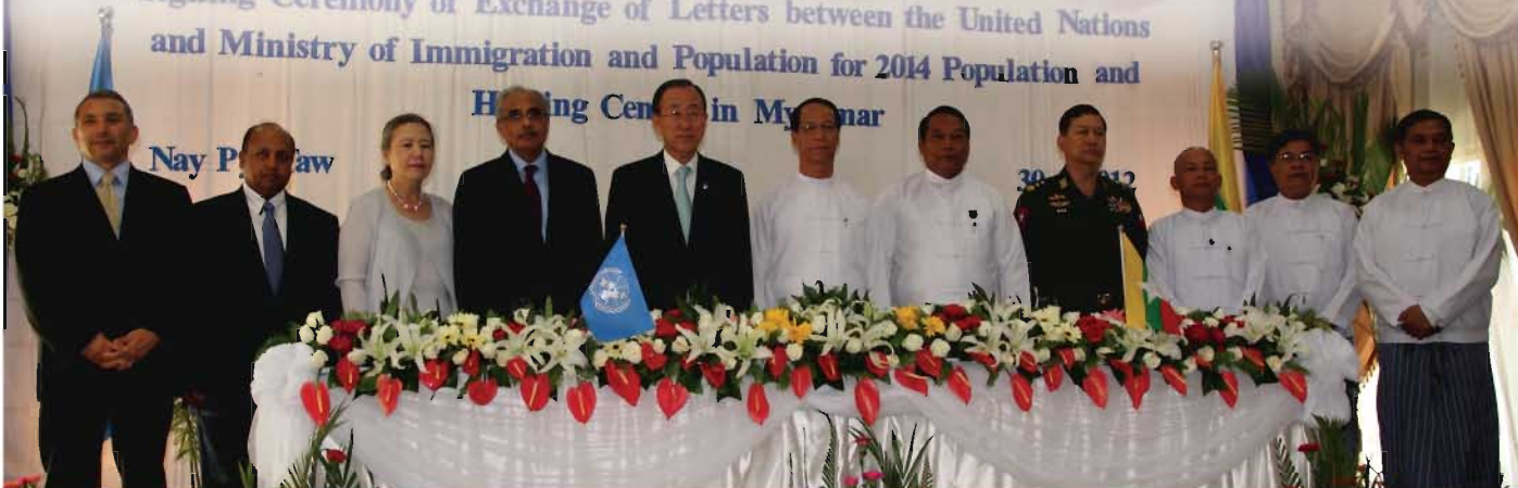
၂၀၁၄ ခုနှစ် လူဦးရေသန်းခေါင်စာရင်းကောက်ယူရေးလုပ်ငန်းအတွက် နိုင်ငံတော်အစိုးရနှင့်ကုလသမဂ္ဂအကြား စာချုပ်လွှာလဲလှယ်သည့်အခမ်းအနားတွင် ကုလသမဂ္ဂအထွေထွေအတွင်းရေးမှူးချုပ် မစ္စတာဘန်ကီမွန်၊ ဒုတိယသမ္မတ ဒေါက်တာစိုင်းမောက်ခမ်း၊ ကုလသမဂ္ဂအတွင်းရေးမှူးချုပ်၏ မြန်မာနိုင်ငံဆိုင်ရာအထူးအကြံပေးအရာရှိ ဝီဂျို နမ်ဘီးယား၊ လူဝင်မှုကြီးကြပ်ရေးနှင့် ပြည်သူ့အင်အားဝန်ကြီးဌာန ပြည်ထောင်စုဝန်ကြီး ဦးခင်ရီ၊ ကုလသမဂ္ဂနှင့် အစိုးရပိတ်ဖက်များအား ပြင်တွေ့ခဲ့ရပါ

စာရင်းကောက်ယူမည့်သူများအတွက် သင်တန်းပေးခြင်းသည် လတ်တလောအတွေ့အကြုံအားနည်းချက်များအရ စိန်ခေါ်မှုတစ်ရပ်ဖြစ်ကြောင်း ကုလသမဂ္ဂအတွင်းရေးမှူးချုပ်က မှတ်ချက်ပြုသွားသည်။ အတွင်းရေးမှူးချုပ်က နိုင်ငံတစ်ဝှမ်းလုံး အောင်မြင်စွာ စာရင်းကောက်ယူနိုင်ရန်မှာ နောက်ထပ်စိန်ခေါ်မှုတစ်ရပ်ပင်ဖြစ်ကာ လက်တလောနှင့်အနာဂတ်တွင် အပစ်အခတ်များ ရပ်စဲကြမည့်အဖြစ်နှင့်ချေရုံမည်ဟု မျှော်လင့်မိပါကြောင်းနှင့် လူနည်းစုများနှင့်အရပ်ဖက် လူမှုအဖွဲ့အစည်းများ၏ ပူးပေါင်းပါဝင်ရေးသည် အလွန်အရေးပါကြောင်း ပြောကြားသွားသည်။ ဒုတိယသမ္မတ ဒေါက်တာစိုင်းမောက်ခမ်းက ၂၀၁၄-ခုနှစ် သန်းခေါင်စာရင်းကောက်ယူရေးသည် မြန်မာနိုင်ငံအတွက် အထူးဦးစားပေးဆောင်ရွက်ရမည့် လုပ်ငန်းဖြစ်ကြောင်းနှင့် ပံ့ပိုးကူညီမှုများအတွက် ကုလသမဂ္ဂအတွင်းရေးမှူးချုပ်ကိုလည်း အထူးကျေးဇူးတင်မိပါကြောင်း ပြောကြားသွားသည်။ အစိုးရအနေနှင့် ကုလသမဂ္ဂလူဦးရေရန်ပုံငွေအဖွဲ့နှင့် အနီးကပ်ပူးပေါင်း၍ သန်းခေါင်စာရင်းအရည်အသွေးအတွက် အထူးကြပ်မတ်ဆောင်ရွက်သွားမည်ဖြစ်ကြောင်း၊ သို့မဟုတ် လူဦးရေစာရင်းများ မှန်ကန်တိကျပြီး နိုင်ငံတကာ စံနှုန်းစံညွှန်းများနှင့်အညီ ရလဒ်ကောင်းများ ရရှိနိုင်မည်ဖြစ်ကြောင်း ပြောကြားခဲ့ပါသည်။