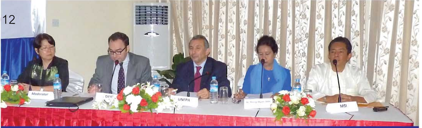
မိသားစုစီမံကိန်းဆိုင်ရာ လန်ဒန်ထိပ်သီးအစည်းဝေးအား ထောက်ခံသည့်အနေဖြင့် မြန်မာနိုင်ငံ၏ သားဆက်ခြားဝန်ဆောင်မှုလုပ်ငန်းများကို ပံ့ပိုးကူညီရန် သတင်းစာရှင်းလင်းပွဲတွင် ဗြိတိန် ဖွံ့ဖြိုးမှုအဖွဲ့အစည်းတစ်ရပ်ဖြစ်သော အပြည်ပြည်ဆိုင်ရာဖွံ့ဖြိုးတိုးတက်မှုဌာန (DFID) မာရီစတုပင်အင်တာနေရှင်နယ် (MSI) နှင့် ကုလသမဂ္ဂလူဦးရေရန်ပုံငွေအဖွဲ့တို့မှ ကိုယ်စားလှယ်များအား တွေ့ မြင်ရစဉ်။

သက္ကရာဇ် ၂၀၂၀ ခုနှစ်တွင် ကမ္ဘာ့အဆင်းရဲဆုံးနိုင်ငံများရှိ အမျိုးသမီးနှင့် မိန်းကလေးငယ် သန်းပေါင်း ၁၂၀ တို့၏ အသက်ကို ကယ်တင်ပေးနိုင်သော သားဆက်ခြားဆိုင်ရာ သတင်းအချက်အလက်၊ စောင့်ရှောက်မှုနှင့် ဆေးဝါးပစ္စည်းများကို ၎င်းတို့တတ်နိုင်သောအားနွှန်းဖြင့် ရရှိစေနိုင်မည့် နည်းလမ်းများကို ရှာဖွေကြံဆောင်ပေးနိုင်ရန်အတွက် ဗြိတိန်အစိုးရ၊ ဘီလ်နှင့်မယ်လင်ဒါဝိတ်စ်ဖောင်ဒေးရှင်းတို့သည် ကုလသမဂ္ဂလူဦးရေရန်ပုံငွေအဖွဲ့နှင့် လက်တွဲ၍ ထူးခြားကြီးမားသည့် ကြိုးပမ်းအားထုတ်မှုကြီးတစ်ရပ်ကို ၂၀၁၂ ခုနှစ် ဇူလိုင်လ ၁၁ ရက်နေ့တွင် စတင်ခဲ့ပါသည်။ ဤလန်ဒန်ထိပ်သီးအစည်းဝေးအရည်အသွေးမြင့် မိသားစုစီမံကိန်း စောင့်ရှောက်မှုလုပ်ငန်းများကို လက်လှမ်းမီအလွယ်တကူ ရရှိစေရေး၊ လက်ခံနိုင်စေရေးနှင့် လူအများသုံးစွဲနိုင်စေရေးအတွက် ကမ္ဘာလုံးဆိုင်ရာ ကတိကဝတ်များကို ရယူခဲ့ပါသည်။ မိသားစုစီမံကိန်း အစီအစဉ်များကို ပိုမိုအားဖြည့်ပေးမည့် နည်းဗျူဟာများကို အကြံပြုတင်ပြခဲ့ကြပြီး အိတ်ချ်အိုင်ဗီဝန်ဆောင်မှုလုပ်ငန်းများအပါအဝင် မျိုးဆက်ပွားကျန်းမာရေး၊ မိခင်၊ မွေးကင်းစနှင့် ကလေးကျန်းမာရေးအစီအစဉ်များတွင် မိသားစုစီမံကိန်းကို ပိုမိုကျယ်ပြန့်စွာ ပေါင်းစပ်ထည့်သွင်းရန်ကိုလည်း ဆွေးနွေးခဲ့ကြသည်။