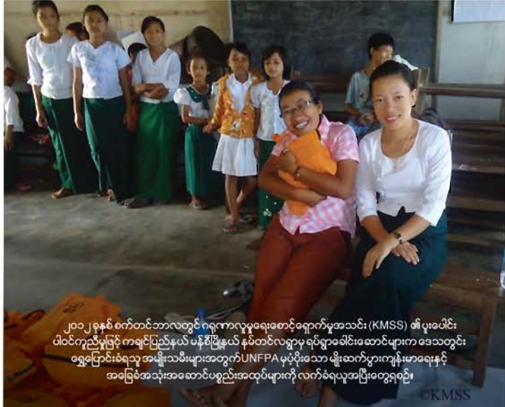
၂၀၁၂ ခုနှစ် စက်တင်ဘာလတွင် ဂရုဏာလူမှုရေးစောင့်ရှောက်မှုအသင်း (KMSS) ၏ ပူးပေါင်းပံ့ပိုးမှုဖြင့် ကချင်ပြည်နယ် မန်စီမြို့နယ် နှစ်တင်လရွာမှ ရပ်ရွာခေါင်းဆောင်များက ဒေသတွင်း ရွှေ့ပြောင်းခံရသူ အမျိုးသမီးများအတွက် UNFPA မှပံ့ပိုးသော မျိုးဆက်ပွားကျန်းမာရေးနှင့် အခြေခံအသုံးအဆောင်ပစ္စည်းအထုပ်များကို လက်ခံရယူပြီး တွေ့ရစဉ်။