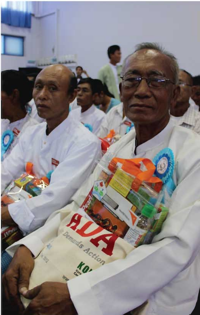
၂၀၂၃ ခုနှစ် အောက်တိုဘာ (၁) ရက်နေ့ နေပြည်တော်၌ အပြည်ပြည်ဆိုင်ရာ သက်ကြီးရွယ်အိုများ နေ့အခမ်းအနားသို့ တက်ရောက်လာကြသော သက်ကြီးရွယ်အိုများကူညီစောင့်ရှောက်ရေးကိုယ်ထူ ကိုယ်ထအဖွဲ့ဝင်များအား တွေ့မြင်ရစဉ်။

ကမ္ဘာ့ကုလသမဂ္ဂအဖွဲ့ကြီးသည် သက်ကြီးရွယ်အိုများအား လူမှုအဖွဲ့အစည်း၏ ဝန်ထုပ်ဝန်ပိုးမဟုတ်ဘဲ အဖိုးတန်ပိုင်ဆိုင်မှုများအဖြစ် အသိအမှတ်ပြုခြင်းဖြင့် သက်ကြီးရွယ်အိုအချိုးအစား မြင့်မားလာမှုအပေါ် ပိုမိုကောင်းမွန်သော အမြင်များရှိလာစေရန် ကြိုးပမ်းဆောင်ရွက်လျက်ရှိပါသည်။ အပြည်ပြည်ဆိုင်ရာ သက်ကြီးရွယ်အိုများနေ့အတွက် ကုလသမဂ္ဂအထွေထွေအတွင်းရေးမှူးချုပ် မစ္စတာဘန်ကီမွန်းက ပေးလိုသော သဝဏ်လွှာတွင် 'အသက်ရှည်ခြင်းသည် လူထုကျန်းမာရေးစောင့်ရှောက်မှုလုပ်ငန်းများ၏ စွမ်းဆောင်အောင်မြင်မှုတစ်ခု ဖြစ်ပါသည်။ လူမှုရေး သို့မဟုတ် စီးပွားရေးဆိုင်ရာ ဝန်ထုပ်ဝန်ပိုးတစ်ခု မဟုတ်ပါ။ ယနေ့ အပြည်ပြည်ဆိုင်ရာသက်ကြီးရွယ်အိုများနေ့တွင် အဘိုးအဘွားများ၏ ဘဝသဘာဝစံပြေမှုရှိစေရေးကို ဆောင်ရွက်ပေးဖို့ ကတိပြုကြပါစို့။ အဘိုးအဘွား များ၏ အသိပညာဗဟုသုတများနှင့် စွမ်းဆောင်ချက်များကြောင့် ကျွန်ုပ်တို့အား လုံး အကျိုးကျေးဇူးများ ရရှိစေမည်ဖြစ်သည့်အတွက် အဘိုးအဘွားများအား လူ့ဘောင်ကောင်းကျိုးအတွက် အဓိပ္ပာယ်ပြည့်ဝစွာ ပါဝင်ဆောင်ရွက်ပေးကြပါရန် တောင်းဆိုကြပါစို့' ဟု ပြောကြားထားပါသည်။