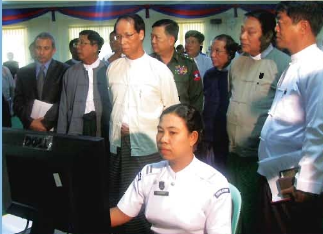
ဒုတိယသမ္မတနှင့် ဗဟိုသန်းခေါင်စာရင်းကော်မရှင်နာယက ဒေါက်တာစိုင်းမောက်ခမ်း၊ ၂၀၁၄-ခုနှစ်တွင်ပြုလုပ်မည့် လူဦးရေရန်ပုံငွေအဖွဲ့အစည်းကော်မရှင်ပြင်ဆင်ဆောင်ရွက်မှုများကို ၂၀၁၂-ခုနှစ် အောက်တိုဘာလ(၁၀)ရက်နေ့က ကြိုတင်ပြင်ဆင်ခဲ့သည်။