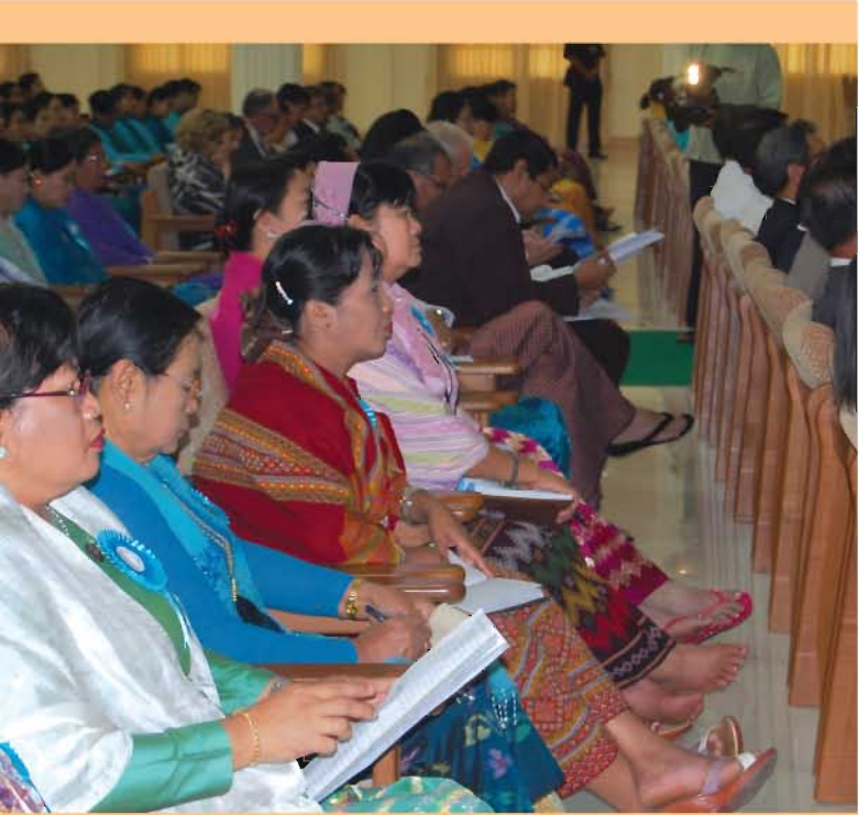
၂၀၁၂ ခုနှစ် အပြည်ပြည်ဆိုင်ရာ အမျိုးသမီးများနေ့အခမ်းအနားသို့ တက်ရောက်လာကြသော အစိုးရဌာန၊ ရပ်ရွာလူထုအခြေပြုအဖွဲ့အစည်းများ၊ ပြည်တွင်းရိုအစိုးရမဟုတ်သောအဖွဲ့အစည်းများ၊ ကုလသမဂ္ဂနှင့် သံတမန်အဖွဲ့အစည်းများမှတာဝန်ရှိသူများ၊ ပြည်သူ့လွှတ်တော်ကိုယ်စားလှယ်များကို တွေ့မြင်ရစဉ်။

အခြားသောလူ့အခွင့်အရေးချိုးဖောက်မှုအန္တရာယ်များ ကိုပိုမိုကြုံတွေ့စေနိုင်သည် ဟု ထောက်ပြထားသည်။ 'ကျေးလက်နေအမျိုးသမီးများ၏ နိုင်ငံရေး၊ လူမှုရေးနှင့် စီးပွားရေးအဆင့်အတန်းကို မြှင့်တင်ပေးခြင်းသည် ၎င်းတို့ကိုယ်တိုင်အတွက် အသက်တမျှအရေးကြီးသလို ဆင်းရဲမွဲတေမှုကိုအမြစ်ပြတ်တိုက်ဖျက်ရန် နည်းဗျူဟာများ၊ အမျိုးသမီးများ၏ရပိုင်ခွင့်ကို ကာကွယ်စောင့်ရှောက်ရန်နှင့် ရေရှည်တည်တံ့ခိုင်မြဲသော ဖွံ့ဖြိုးတိုးတက်မှုကို ဖော်ဆောင်ရာတွင်လည်း အရေးကြီးပါသည်။ အမျိုးသမီးများ၏ ကျန်းမာရေး၊ ပညာရေးနှင့်ရပိုင်ခွင့်များ တိုးတက်ကောင်းမွန်အောင်ဆောင်ရွက်ပေးရန်၊ ကျားမတန်းတူညီမျှရှိမှုကို တည်ဆောက်ရန်၊ ကိုယ်ဝန်တိုင်း၊ လိုလားသည့်မွေးဖွားမှုတိုင်းကိုအန္တရာယ်ကင်းစေရန်၊ လူငယ်တိုင်းသည်အလားအလာရှိသလောက် ဖွံ့ဖြိုးတိုးတက်နိုင်ရန်၊ အခွင့်အလမ်းများ ရှိသည့် ကမ္ဘာကြီးကိုတည်ဆောက်ရာတွင် ပါဝင်ကြရန် စသည်ဖြင့် တာဝန်ရှိသူများ အားလုံးကိုမိတ်ခေါ် တိုက်တွန်းထားပါသည်။