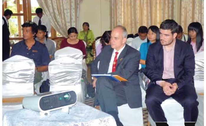
သတင်းစာရှင်းလင်းပွဲသို့တက်ရောက်လာသူများအားတွေ့ရစဉ်

ကုလသမဂ္ဂလူဦးရေရန်ပုံငွေအဖွဲ့သည် လွန်ခဲ့သည့် နှစ်ပေါင်း ၃၀ ကာလအတွင်း မြန်မာနိုင်ငံတွင် ကျန်းမာရေးဝန်ကြီးဌာန၊ အစိုးရမဟုတ်သော အဖွဲ့အစည်းများနှင့် လက်တွဲကာ မျိုးဆက်ပွားကျန်းမာရေးအစီအစဉ်များကို ပံ့ပိုးပေးခဲ့ပြီး သားဆက်ခြားဆေးဝါးပစ္စည်းများကို အဓိကပံ့ပိုးပေးနေသည့် အဖွဲ့အစည်း ဖြစ်ပါသည်။ သို့သော် မျိုးဆက်ပွားနိုင်သည့် အသက်အရွယ်အတွင်းရှိ အိမ်ထောင်ရှင်မြန်မာအမျိုးသမီး လေးပုံတစ်ပုံနီးပါးသည် သားဆက်ခြားနည်းလမ်းများကို သုံးစွဲလိုသော်လည်း သုံးစွဲနိုင်ခြင်းမရှိဟု ကုလသမဂ္ဂလူဦးရေရန်ပုံငွေအဖွဲ့၊ မြန်မာနိုင်ငံဌာနေကိုယ်စားလှယ် မစ္စတာမိုဟာမက် အဗွဒယ်လ်အာဟတ်က ပြောကြားခဲ့သည်။ မြန်မာနိုင်ငံရှိ မိခင်များသေဆုံးရခြင်းနှင့် မသန်မစွမ်းဖြစ်ရခြင်း၏ အဓိကအကြောင်းရင်းတစ်ခုဖြစ်သော အန္တရာယ်ရှိသည့် ကိုယ်ဝန်ဖျက်ချခြင်းကို ကာကွယ်နိုင်ရန်အတွက် အစိုးရနှင့်ဖွံ့ဖြိုးမှုဆိုင်ရာ လုပ်ငန်းဆောင်ရွက်နေသော မိတ်ဖက်အဖွဲ့အစည်းများမှ ခေတ်မီသားဆက်ခြား ဆေးဝါးပစ္စည်းများကို ရရှိအောင် ကြိုးပမ်းဆောင်ရွက်ခြင်းသည် အလွန်အရေးပါကြောင်းကိုလည်း ၎င်းကဆက်လက် ပြောကြားခဲ့သည်။