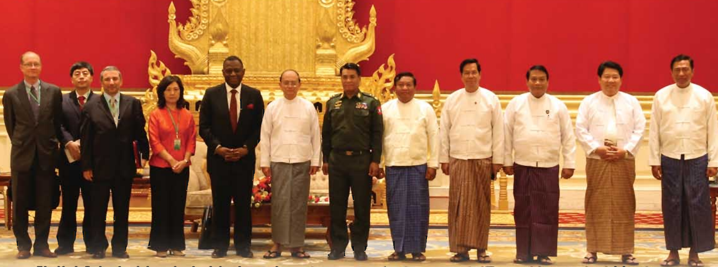
မြန်မာနိုင်ငံ၏ ဖွံ့ဖြိုးတိုးတက်မှုလုပ်ငန်းများတွင် ဆက်လက်ပံ့ပိုးကူညီရေးအတွက် လာရောက်ခဲ့သော ကုလသမဂ္ဂလူဦးရေရန်ပုံငွေအဖွဲ့ အမှုဆောင်ညွှန်ကြားရေးမှူး ဒေါက်တာ ဘာသာသတ္တိ ဒေးဆိုတီမေဟင်က နိုင်ငံတော်သမ္မတဦးသိန်းစိန်နှင့် အဓိကအမျိုးသားခေါင်းဆောင်များအား တွေ့ဆုံခဲ့စဉ်။

ကုလသမဂ္ဂလူဦးရေရန်ပုံငွေအဖွဲ့ အမှုဆောင်ညွှန်ကြားရေးမှူးဖြစ်သူ ဒေါက်တာ ဘာသာသတ္တိ ဒေးဆိုတီမေဟင်သည် ၂၀၁၂ ခုနှစ် ဩဂုတ်လအတွင်း မြန်မာနိုင်ငံသို့ သုံးရက်ကြာလာရောက်လည်ပတ်ခဲ့ပြီး နိုင်ငံတော်အဖွဲ့အစည်းများနှင့်တွေ့ဆုံကာ မြန်မာနိုင်ငံ၏ ဖွံ့ဖြိုးတိုးတက်မှုနှင့် ပြုပြင်ပြောင်းလဲမှုလုပ်ငန်းများတွင် ကုလသမဂ္ဂလူဦးရေရန်ပုံငွေအဖွဲ့အနေဖြင့် မည်သို့ရှေ့ဆက်ပံ့ပိုးကူညီမည်ဆိုသည်ကို ဆွေးနွေးခဲ့ပါသည်။ ထိုခရီးစဉ်အတွင်း ဒေါက်တာအိုဆိုတီမေဟင်သည် နိုင်ငံတော်သမ္မတဦးသိန်းစိန်နှင့် တွေ့ဆုံရာတွင်လည်း ၂၀၁၄ လူဦးရေသန်းခေါင်စာရင်းကောက်ယူရေး၊ မျိုးဆက်ပွားကျန်းမာရေး စောင့်ရှောက်မှုများ တိုးတက်ကောင်းမွန်စေရေး၊ လူငယ်အရေးကိစ္စများကို ဘက်ပေါင်းစုံမှကိုင်တွယ်ဖြေရှင်းပေးနိုင်သည့် မူဝါဒများချမှတ်ရေးတို့ကို ဆွေးနွေးခဲ့သည်။ လူဦးရေသန်းခေါင်စာရင်းကောက်ယူရာတွင် ကမ္ဘာ့ကုလသမဂ္ဂအဖွဲ့ကြီး၏ အပြည်ပြည်ဆိုင်ရာစံသတ်မှတ်ချက်များကို လိုက်နာရန်နှင့် နိုင်ငံတွင်းရှိ တိုင်းရင်းသားလူမျိုးစုများအားလုံးကို ထည့်သွင်းကောက်ယူရန် အရေးကြီးကြောင်းကို အလေးထားပြောကြားခဲ့သည်။ နိုင်ငံတော်သမ္မတသည် ဤသို့ အမှုဆောင်ညွှန်ကြားရေးမှူး လာရောက်လည်ပတ်မှုနှင့် မြန်မာနိုင်ငံဖွံ့ဖြိုးတိုးတက်မှုအတွက် ကုလသမဂ္ဂလူဦးရေရန်ပုံငွေအဖွဲ့၏ ကူညီပံ့ပိုးမှုများအတွက် ကျေးဇူးတင်ဝမ်းမြောက်ကြောင်း ပြန်လည်ပြောကြားခဲ့သည်။