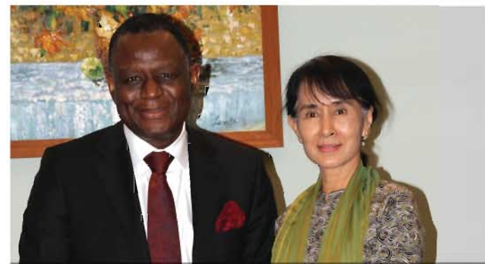
လူငယ်များ၏ ဘဝသာယာရေးနှင့် စွမ်းဆောင်ရည်မြှင့်တင်ပေးရေး အမျိုးသမီးများ၏ မျိုးဆက်ပွားကျန်းမာရေးကိစ္စများတွင် ထောက်ခံပံ့ပိုးမှုရရှိရန် ဆွေးနွေးအပြီးတွင် ကုလသမဂ္ဂလူဦးရေရန်ပုံငွေအဖွဲ့ အမှုဆောင်ညွှန်ကြားရေးမှူး ဒေါက်တာအိုဆိုတီမေဟင်အား နီဘယ်(လ်) ရာရှင် ခေါ်အောင်ဆန်းစုကြည်နှင့်အတူ ၂၀၁၂ ခုနှစ် ဩဂုတ်လ (၂၇) ရက်နေ့တွင် နေပြည်တော်၌ တွေ့မြင်ရစဉ်။

အလည်အပတ်ခရီးစဉ် နောက်ဆုံးနေ့တွင် ဒေါက်တာအိုဆိုတီမေဟင်သည် မြန်မာနိုင်ငံဆရာဝန်အသင်း၊ လူငယ်ဖွံ့ဖြိုးမှု အစီအစဉ်မှ လူငယ်ကိုယ်စားလှယ် ခေါင်းဆောင်များနှင့် တွေ့ဆုံရာ၌ ၎င်း၏ မြန်မာနိုင်ငံသို့ သုံးရက်ကြာအလည်အပတ်ခရီးစဉ်အကြောင်းကို ပြန်လည်ရှင်းလင်းပြောကြားခဲ့သည်။ လူငယ်များက အိပ်ချ်အိုင်ဗီ တားဆီးကာကွယ်ရေးအပါအဝင် မျိုးဆက်ပွား ကျန်းမာရေးဆိုင်ရာ အသိပညာပေးပညာပေးမှုများ တိုးပွားရရှိစေရေးအတွက် ၎င်းတို့၏ ကြိုးပမ်းဆောင်ရွက်နေမှုများကို တင်ပြခဲ့ကြရာတွင် ဒေါက်တာအိုဆိုတီမေဟင်က အလေးအနက်စူးစိုက် နားထောင်ပေးခဲ့သည်။ ဒေါက်တာအိုဆိုတီမေဟင်က လူငယ်များအား စွမ်းဆောင်ရည်မြှင့်တင်ပေးခြင်းသည် ကုလသမဂ္ဂ လူဦးရေရန်ပုံငွေအဖွဲ့၏ ဦးစားပေးလုပ်ငန်းတစ်ရပ်ဖြစ်ကြောင်း၊ နေပြည်တော်တွင် နိုင်ငံခေါင်းဆောင်များနှင့် တွေ့ဆုံခဲ့ရာတွင်လည်း လူငယ်များ၏ ကျန်းမာရေး၊ ပညာရေးနှင့်အလုပ်အကိုင်အခွင့်အလမ်းများ တိုးတက်ရရှိလာစေမည့် မူဝါဒများချမှတ်ရာတွင် လူငယ်များ ကိုယ်တိုင်ပါဝင်ဆောင်ရွက်နိုင်ရန် ကူညီလိုကြောင်း၊ ၎င်း၏ ကမ်းလှမ်းမှုအား ခေါင်းဆောင်များက လက်ခံခဲ့ကြကြောင်းကိုလည်း ပြောကြားခဲ့သည်။ ထို့ပြင် အမှုဆောင်ညွှန်ကြားရေးမှူးက လူငယ်များအား ၎င်းတို့၏ စွမ်းဆောင်ရည်များကို တိုးတက်သည်ထက်တိုးတက်အောင် မြှင့်တင်ကြရန်နှင့် ပြောင်းလဲမှုကို ဖော်ဆောင်သူများဖြစ်လာအောင် ကြိုးစားကြရန် တိုက်တွန်းအားပေးခဲ့သည်။ ထိုအားပေးစကားများနှင့် ကုလသမဂ္ဂလူဦးရေရန်ပုံငွေအဖွဲ့၏ ခိုင်မာသည့်ရပ်တည်မှုကို ပြသနိုင်ခဲ့ခြင်းကြောင့် လူငယ်များအနေနှင့် များစွာအားတက်ဝမ်းမြောက်ကာ တိုင်းပြည်ဖွံ့ဖြိုးတိုးတက်မှုအတွက် ရှေးရှုပြီး ကြိုးပမ်းဆောင်ရွက်သွားမည်ဖြစ်ကြောင်း တတိမြုခဲ့ကြပါသည်။