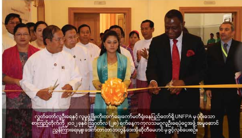
လွှတ်တော်လူဦးရေနှင့် ဖွံ့ဖြိုးတိုးတက်ရေးကော်မတီရုံးနေပြည်တော်ရှိ UNFPA မှ ပံ့ပိုးသော စာကြည့်တိုက်ကို ၂၀၁၂ ခုနှစ် ဩဂုတ်လ (၂၉) ရက်နေ့က ကုလသမဂ္ဂလူ့ဦးရေရန်ပုံငွေအဖွဲ့ အဖွဲ့ဆောင် ညွှန်ကြားရေးမှူး ဒေါက်တာဘာဘာတွန်ဒေးအိုဆိုတီမေဟင် မှ ဖွင့်လှစ်ပေးခဲ့ခြင်း။

ထိုင်းနိုင်ငံ ဘန်ကောက်မြို့တွင် ၂၀၁၂-ခုနှစ် ဧပြီလ(၂၁)ရက်နှင့် (၂၂)ရက်များက အိပ်ချ်အိုင်ဗီ / အေအိုင်ဒီအက်စ် ဥပဒေ ပြဋ္ဌာန်း ရေးဆိုင်ရာ အင်ဒို-ချိုင်းနား ရည်မှန်းအုပ်စု ဆွေးနွေးပွဲတစ်ရပ်ကို ကျင်းပပြုလုပ်ခဲ့သည်။ ဆွေးနွေးပွဲသို့ လွှတ်တော်လူဦးရေနှင့် ဖွံ့ဖြိုး တိုးတက်ရေးကော်မတီအတွင်းရေးမှူး ဦးမြင့်သူဦးဆောင်သော ကိုယ် စားလှယ်အဖွဲ့ဝင်(၄)ဦး တက်ရောက်ခဲ့သည်။