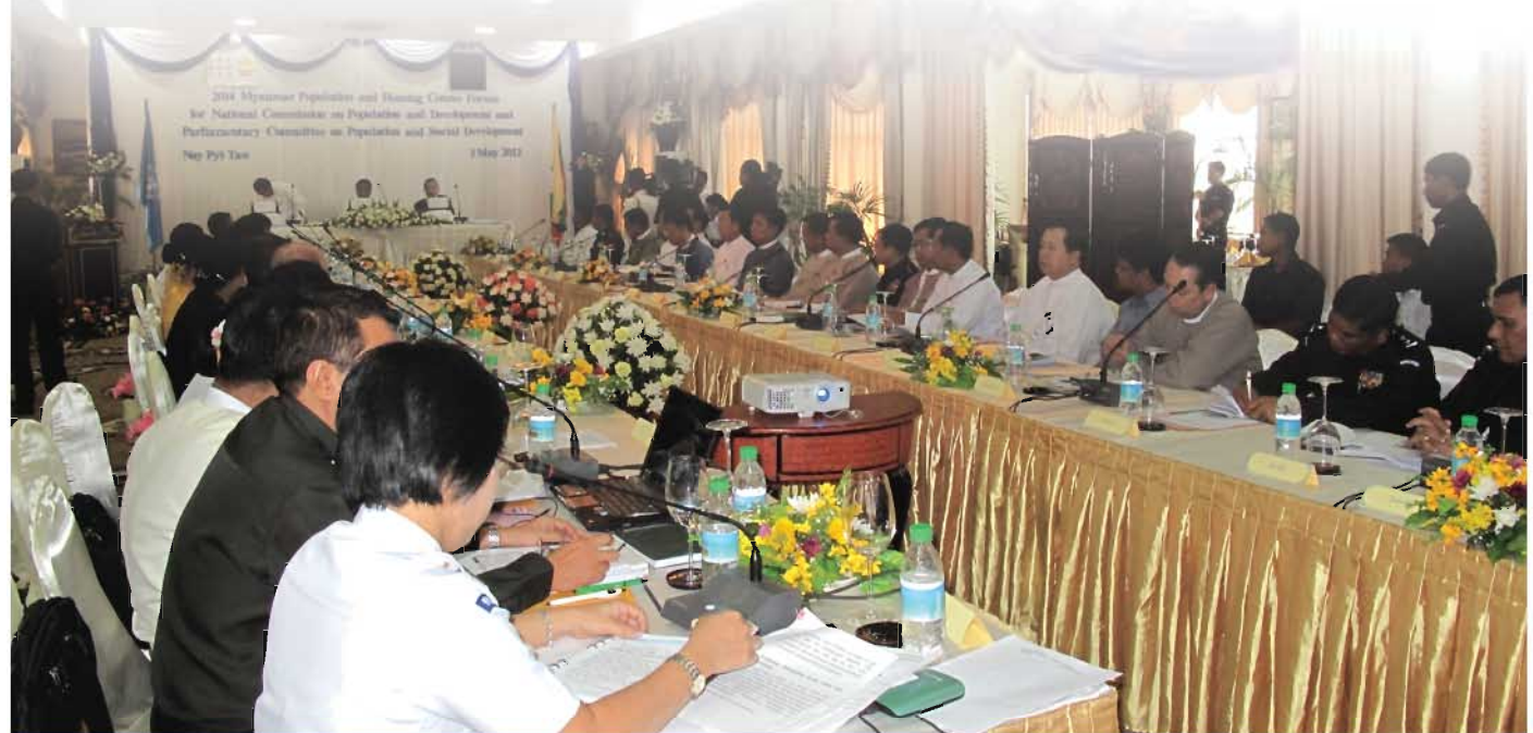
၂၀၁၄ ခုနှစ် မြန်မာနိုင်ငံ လူဦးရေသန်းခေါင်စာရင်းကောက်ယူခြင်းလုပ်ငန်းအတွက် ညှိနှိုင်းဆွေးနွေးပွဲတွင် မြန်မာနိုင်ငံလွှတ်တော်လူဦးရေနှင့်လူမှုရေးဖွံ့ဖြိုးတိုးတက်ရေးကော်မတီနှင့် အမျိုးသားလူဦးရေနှင့် ဖွံ့ဖြိုးတိုးတက်ရေးကော်မရှင်အဖွဲ့ဝင်များ ဆွေးနွေးနေကြစဉ်။