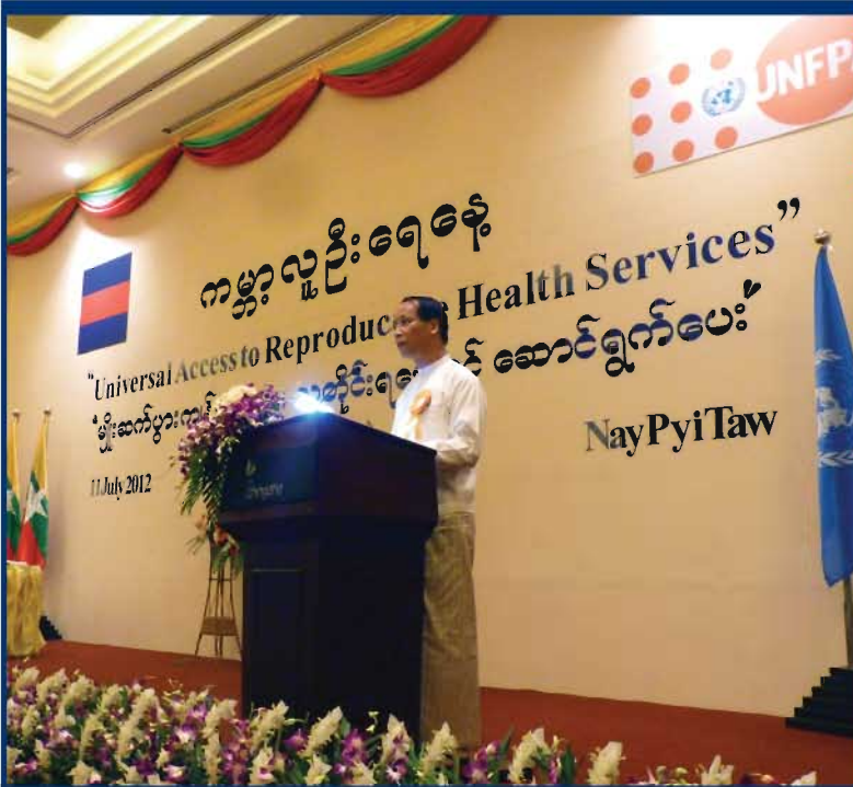
နေပြည်တော်၌ ၂၀၁၂ ခုနှစ်၊ ဇူလိုင်လ (၁၁) ရက်နေ့တွင် ကျင်းပခဲ့သော ကမ္ဘာ့လူဦးရေနေ့ အခမ်းအနားတွင် ပြည်ထောင်စုမြန်မာနိုင်ငံတော်ဒုတိယသမ္မတဒေါက်တာစိုင်းမောက်ခမ်းမှ အဖွင့်အမှာစကားပြောကြားနေစဉ်။

ကုလသမဂ္ဂဖွံ့ဖြိုးမှုအစီအစဉ် ဌာနကိုယ်စားလှယ်နှင့် ကုလသမဂ္ဂဌာန ညှိနှိုင်းရေးမှူး၊ လူသားချင်းစာနာထောက်ထားမှု ဆိုင်ရာညှိနှိုင်းရေးမှူး၊ မစ္စတာအာရှော့ခီနီဝန်က ကမ္ဘာ့လူဦးရေနေ့အတွက် ကုလသမဂ္ဂအထွေထွေ အတွင်းရေးမှူးချုပ်၏ သဝဏ်လွှာကို ဖတ်ကြားခဲ့သည်။ ထိုသဝဏ်လွှာတွင် ကုလသမဂ္ဂအဖွဲ့ဝင်နိုင်ငံများအားလုံးက မျိုးဆက်ပွားကျန်းမာရေးစောင့်ရှောက်မှုကို ပိုမိုလက်လှမ်းမီရရှိလာစေရေး အရေးကြီးအတူတကွ အားထုတ်လုပ်ဆောင်ရွက်ရန် တိုက်တွန်းနှိုးဆော်ထားသည်။ အထွေထွေအတွင်းရေးမှူးချုပ်က ကမ္ဘာ့နိုင်ငံများအနေနှင့် ဖွံ့ဖြိုးမှုနှင့်ဆင်းရဲနွမ်းပါးမှုလျော့ချရေး အစီအစဉ်များတွင် မျိုးဆက်ပွားကျန်းမာရေးနှင့် အခွင့်အလမ်းများကို ထည့်သွင်းရေးဆွဲသင့်ကြောင်း တိုက်တွန်းထားပြီး မျိုးဆက်ပွားကျန်းမာရေး လူတိုင်းလက်လှမ်းမီစေရေးအတွက် ရင်းနှီးမြှုပ်နှံခြင်းသည် ကျန်းမာသော လူမှုအဖွဲ့အစည်းနှင့် ရေရှည်တည်တံ့သော အနာဂတ်တို့ကို ဖော်ဆောင်ခြင်းဖြစ်ကြောင်း သတိပေးထားပါသည်။