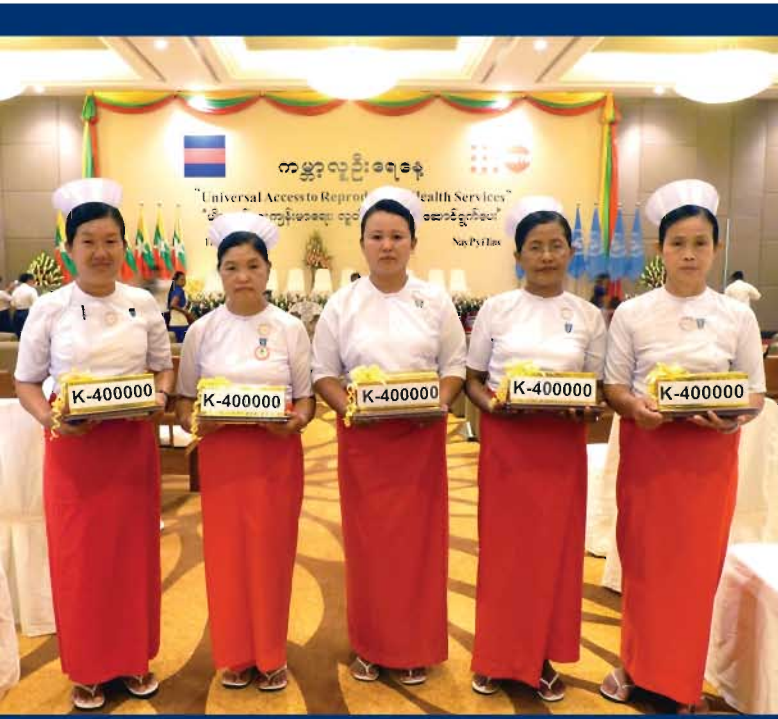
၂၀၁၂ ခုနှစ် ကမ္ဘာ့လူဦးရေနေ့ အခမ်းအနားတွင် မျိုးဆက်ပွားကျန်းမာရေးကို ပြည်သူလူထုပိုမိုလက်လှမ်းမီရရှိစေရန် စံနမူနာပြု ကြိုးပမ်းဆောင်ရွက်ခဲ့သော ထူးချွန်သားဖွားဆရာမ (၅) ဦးအား ဂုဏ်ပြုဆုများချီးမြှင့်ခဲ့စဉ်။

ထိုအခမ်းအနားတွင် မျိုးဆက်ပွားကျန်းမာရေး လူတိုင်း လက်လှမ်းမီရရှိရေး ဆိုင်ရာ ဓါတ်ပုံနှင့် ဆောင်းပါးပြိုင်ပွဲများတွင် ဆုရရှိသူများကိုလည်း ဆုများ ချီးမြှင့်ပေးအပ်ခဲ့သည်။ မျိုးဆက်ပွားကျန်းမာရေးကို ပြည်သူလူထု ပိုမိုလက်လှမ်းမီရရှိစေရန် ရှေ့တန်းမှ စံနမူနာပြု ကြိုးပမ်းဆောင်ရွက်နေသူများအား အသိအမှတ်ပြုသည့်အနေဖြင့် ထူးချွန်သော သားဖွားဆရာမငါးဦးအား အမျိုးသမီးများနှင့်ကလေးများ၏ အသက်ကို ကယ်တင်နိုင်ခဲ့သည့် ၎င်းတို့၏ ပြောင်မြောက်သော ဆောင်ရွက်ချက်များအတွက် ဂုဏ်ပြုဆုများ ချီးမြှင့်ပေးခဲ့ပါသည်။