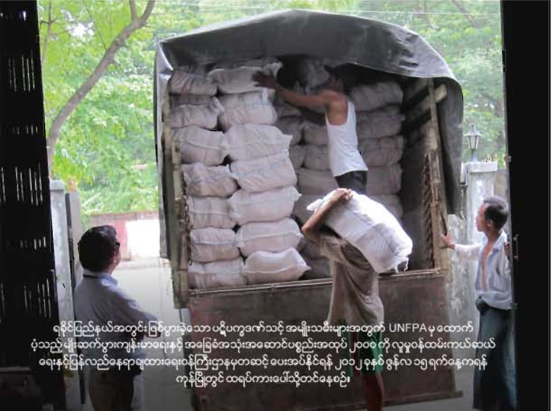
ရခိုင်ပြည်နယ်အတွင်း ဖြစ်ပွားခဲ့သော ပဋိပက္ခဒက်သင့် အမျိုးသမီးများအတွက် UNFPA မှထောက်ပံ့သည့် မျိုးဆက်ပွားကျန်းမာရေးနှင့် အခြေခံအသုံးအဆောင်ပစ္စည်းအထုပ် ၂၀၀၀ ကို လှူဒါန်းထမ်းကယ်ဆယ်ရေးနှင့် ပြန်လည်နေရာချထားရေးဝန်ကြီးဌာနမှတစ်ဆင့် ပေးအပ်နိုင်ရန် ၂၀၁၂ ခုနှစ် ဇွန်လ ၁၅ ရက်နေ့က ရန်ကုန်မြို့တွင် ထရပ်ကားပေါ်သို့တင်နေစဉ်။

ထို့ပြင် မြစ်ကြီးနားမြို့နယ်အတွင်းရှိ စစ်ဘေးဒုက္ခသည်သားစုများအတွက် အမျိုးသမီးများကျန်းမာရေးနှင့် အခြေခံအသုံးအဆောင်ပစ္စည်း အထုပ် ၁၅၀၀ မဖြန့်ဝေမီနှင့် အရေးပေါ် မျိုးဆက်ပွားကျန်းမာရေးဆိုင်ရာ ပစ္စည်းကိရိယာ ၅ စုံကို မပံ့ပိုးမီ ဗန်းမော်မြို့နယ်အတွင်းရှိ ဒေသခံကျန်းမာရေးဝန်ထမ်းများနှင့် အခြားသောအဖွဲ့အစည်းများမှ လုပ်ငန်းနှင့်သက်ဆိုင်သည့်ဝန်ထမ်းများအား ဒေသတွင်း အခြေစိုက် လုပ်ဆောင်နေသည့် Medicine du Monde (MdM) နှင့် ပူးပေါင်း၍ မျိုးဆက်ပွားကျန်းမာရေး စောင့်ရှောက်မှု မျိုးဆက်ပွားကျန်းမာရေးဆိုင်ရာ တစ်ကိုယ်ရေသန့်ရှင်းမှု၊ အမျိုးသမီးများအတွက် အရေးပေါ်ပြုစုစောင့်ရှောက်ရေးနှင့် ညွှန်းပို့ရေးဆိုင်ရာ သင်တန်းများကို ပို့ချပေးခဲ့သည်။ ဂရုဏာလူမှုရေးစောင့်ရှောက်မှုအသင်းသည် အမျိုးသမီးများ ကျန်းမာရေးဆိုင်ရာ အသုံးအဆောင်ပစ္စည်းများပါသည့် သေတ္တာ Dignity Kits သည် ဒုက္ခသည် စခန်းများရှိ အမျိုးသမီးများ တစ်ကိုယ်ရေသန့်ရှင်းရေး တိုးတက်ကောင်းမွန်ရေးအတွက် လွန်စွာအထောက်အကူပြုကြောင်း သတင်းပေးပို့ခဲ့သည်။