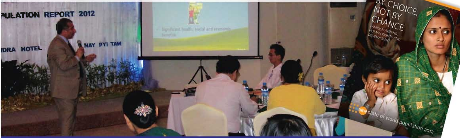
ကုလသမဂ္ဂလူဦးရေရန်ပုံငွေအဖွဲ့ကမ္ဘာလူဦးရေအခြေအနေ ၂၀၁၂ ခုနှစ် အစီရင်ခံစာအား မိတ်ဆက်ပွဲအခမ်းအနားတွင် ကုလသမဂ္ဂလူဦးရေရန်ပုံငွေအဖွဲ့ဌာနကွယ်စားလှယ် မစ္စတာဖိုဟာမက်အဗ္ဗယ်လ်အာဟတ် မှ မိသားစုစီမံကိန်းသည် အရေးကြီးပြီး ကျန်းမာရေး၊ လူမှုရေးနှင့် စီးပွားရေးအကျိုးဖြစ်ထွန်းမှုအပေါ် သက်ရောက်မှုရှိကြောင်း တင်ပြနေပေပြီ။

မိသားစုစီမံကိန်း၊ လူ့အခွင့်အရေးနှင့် ဖွံ့ဖြိုးတိုးတက်မှုများသည် တိုက်ဆိုင်မှုမဟုတ်။ ရွေးချယ်မှုသာဖြစ်သည်။