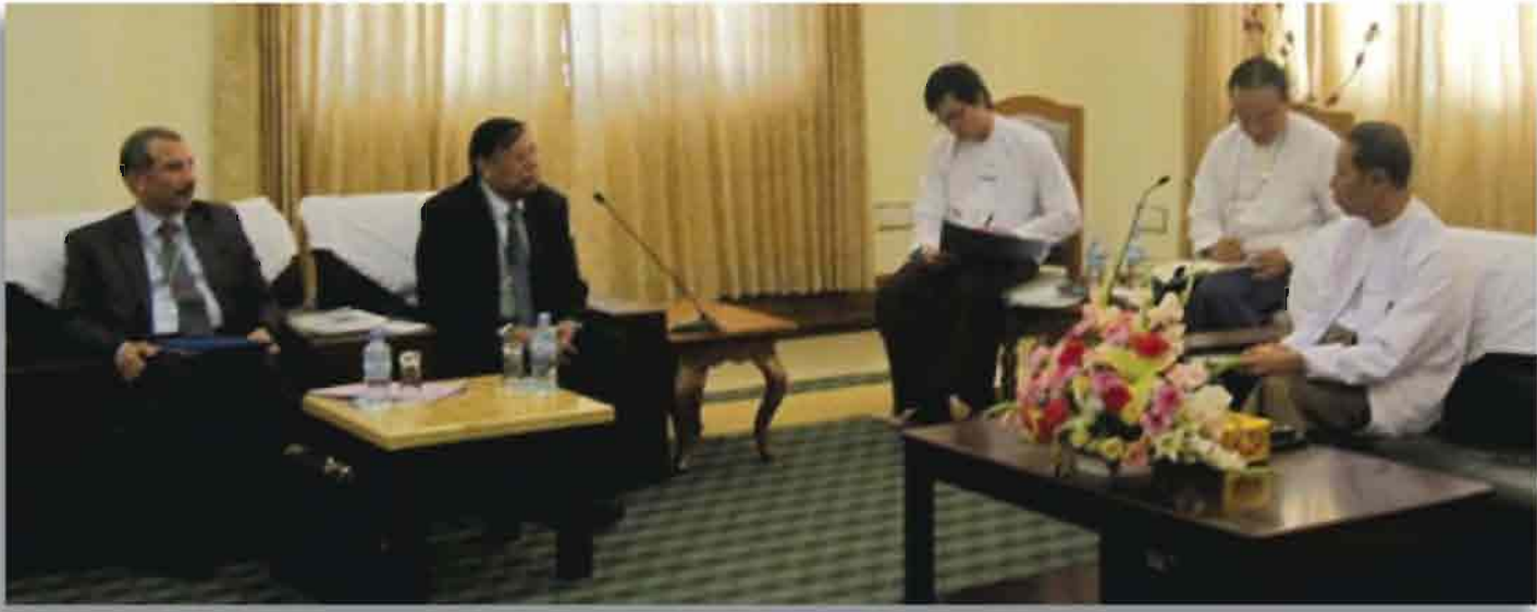
၂၀၁၁ ခုနှစ်၊ နိုဝင်ဘာလ၊ ၂၃ ရက်နေ့တွင် နေပြည်တော်ရှိ ပြည်သူ့လွှတ်တော်အဆောက်အအုံ၌ ပြည်သူ့လွှတ်တော် ဒုတိယဥက္ကဋ္ဌ ဦးနန္ဒကျော်စွာအား AFPPD အမှုဆောင်ညွှန်ကြားရေးမှူးနှင့် ကုလသမဂ္ဂလူဦးရေရန်ပုံငွေအဖွဲ့မှ အရာရှိများက လာရောက်တွေ့ဆုံစဉ်

တိုက်ရိုက်တွင်အခြေစိုက်သော Asian Forum of Parliamentarians on Population and Development (AFPPD) သည် ကျန်းမာရေးနှင့်လူမှုရေးရာများ၊ လူဦးရေနှင့်ဖွံ့ဖြိုးတိုးတက်မှုလုပ်ငန်းများကို ဆောင်ရွက်သောပါလီမန်အမတ်များ၏ ဒေသဆိုင်ရာလွှတ်တော်ကော်မတီဖြစ်ပါသည်။ ၁၉၈၁ခုနှစ်တွင် ကုလသမဂ္ဂလူဦးရေရန်ပုံငွေအဖွဲ့ကစတင်၍ တည်ထောင်ပေးခဲ့သော ၎င်းအဖွဲ့သည် လူဦးရေဖွံ့ဖြိုးတိုးတက်မှုနှင့်ဆက်နွှယ်သောလုပ်ငန်းရပ်များ၌ အာဆီယံပါလီမန်လွှတ်တော်အမတ်များက မိတ်ဖက်ပြုပြီး တိုးမြှင့်ကာပူးပေါင်းဆောင်ရွက်နိုင်စေရန် ရည်ရွယ်၍ ဖွဲ့စည်းထားပါသည်။