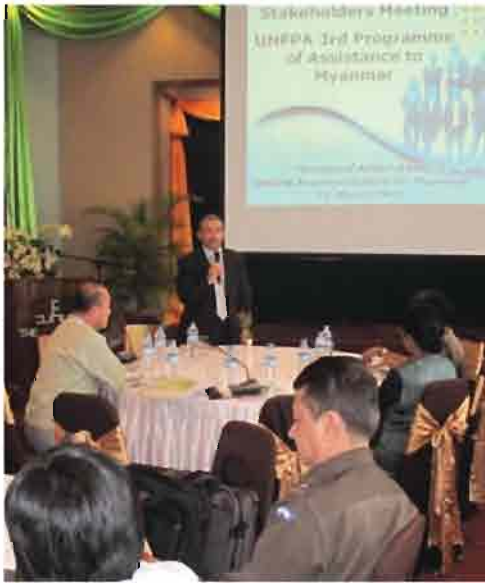
၂၀၁၁ ခုနှစ်၊ မတ်လ၊ ၃၁ ရက်နေ့တွင် နေပြည်တော်၌ကျင်းပခဲ့သော အကျိုးတူပူးပေါင်းဆောင်ရွက်မှုဆွေးနွေးပွဲတွင် ကုလသမဂ္ဂလူဦးရေရန်ပုံငွေအဖွဲ့ ဌာနေကိုယ်စားလှယ် မစ္စတာမိုဟာမက် အဗ္ဗဒယ်လ်အာဟတ်မှ တတိယမြောက် အကူအညီပေးရေးအစီအစဉ် အကြောင်းကို တင်ပြနေစဉ်။

၂၀၁၁ခုနှစ် မတ်လ မှ ဩဂုတ်လအတွင်း အစည်းအဝေးများကို အဆင့်ဆင့်ကျင်းပခဲ့ရာ အစိုးရဌာနများ၊ ပြည်တွင်းနှင့် အပြည်ပြည်ဆိုင်ရာ အစိုးရမဟုတ်သော အဖွဲ့အစည်းများ၊ ကုလသမဂ္ဂအဖွဲ့အစည်းများနှင့် အလှူရှင်အဖွဲ့အစည်းများ ပါဝင်တက်ရောက်ခဲ့ကြပြီး တတိယမြောက်အကူအညီပေးရေးအစီအစဉ်အတွက် အခြေခံအချက်အလက်များနှင့်မျှော်မှန်းရလဒ်သတ်မှတ်ချက်များကို ဆွေးနွေးခဲ့ကြပါသည်။ အဓိကဆွေးနွေးသော အကြောင်းအရာများမှာ အစီအစဉ်၏ ရည်မှန်းအကျိုးကျေးဇူးများ၊ မျှော်မှန်းရလဒ်များ၊ အညွှန်းကိန်းများ၊ မိတ်ဖက်အဖွဲ့အစည်းများနှင့် လုပ်ငန်းနည်းဗျူဟာများဖြစ်ပါသည်။