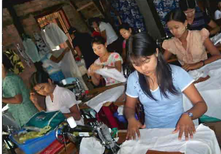
စရာဝတီတိုင်းဒေသကြီး၊ လပွတ္တာမြို့တွင် ကုလသမဂ္ဂလူဦးရေရန်ပုံငွေအဖွဲ့၏အထောက်အပံ့ဖြင့် FXB မှဆောင်ရွက်နေသော "အမျိုးသမီးများဆုံဆည်းရာ" အထည်ချုပ်သင်တန်းမှ အမျိုးသမီးများကို တွေ့ရစဉ်။