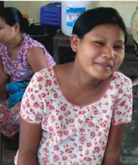
ကုလသမဂ္ဂလူဦးရေရန်ပုံငွေအဖွဲ့နှင့် MSI စီမံချက်၏ မျိုးဆက်ပွားကျန်းမာရေးအကျိုးကျေးဇူးများကို ရရှိခံစားရသော အစည်ကြီးကျေးရွာမှမတင်တင်မိုး၏အပြုံးပန်း။

ကျွန်မ ၁၆ နှစ်မှာ အိမ်ထောင်ကျခဲ့ ပါတယ်။ အဲဒီအချိန်မှာ ကျေးရွာအရောက်ကုသ တဲ့ MSIအဖွဲ့က ရွာကိုရောက်လာပြီး ကိုယ်ဝန် ဆောင်နှင့် မျိုးဆက်ပွားဝန်ဆောင်မှုတွေ အခမဲ့ ဆောင်ရွက်ပေးလို့ ဘာမှလိုလေသေးမရှိခဲ့ဘူး။ မျိုးဆက်ပွားကျန်းမာရေး အသိပညာပေး ဟော ပြောမှုတွေကြောင့် ဘယ်လိုသားဆက်ခြားလို့ရ တယ်၊ ဆေးဘယ်လိုသုံးရမယ်ဆိုတာ ကျွန်မသိ ပါပြီ။ ကိုယ်ဝန်စောင့်ရှောက်မှုလည်း အပြည့်အဝ ရရှိခဲ့ပြီး ကလေးကိုဆေးရုံမှာအန္တရာယ်ကင်းစွာ မွေးဖွားနိုင်ခဲ့ပါတယ်။ အခု သားလေးက ၄လ ရှိပါပြီ။ ကျွန်မအမေထက် ကံကောင်းတဲ့အချက် ကတော့ ဒုတိယကလေးကို ဘယ်အချိန်မှယူ သင့်တယ်ဆိုတာ ကျွန်မတို့ကိုယ်တိုင် ဆုံးဖြတ် ချက်ချင်းနိုင်ပါပြီ။ သားဆက်ခြားဖို့ဆေးဝါးတွေ လည်း အခမဲ့ရရှိပါတယ်။ ကျွန်မ ခင်ပွန်းက အသက် ၂၀ ရှိပြီး ကျပန်းအလုပ်လုပ်ပါတယ်။ ကလေးတွေအများကြီးကို မကျွေးနိုင်တာ အသေအချာပါပဲ။ MSIမှ ဆရာ၊ ဆရာမတွေက