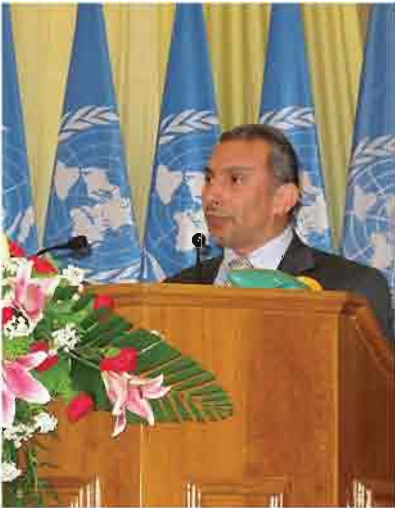
နေပြည်တော်တွင်ကျင်းပသော ၂၀၁၁ ခုနှစ် ကမ္ဘာ့လူဦးရေရန်ပုံငွေအခမ်းအနားတွင် ကုလသမဂ္ဂလူဦးရေရန်ပုံငွေအဖွဲ့ ဌာနကော်မတီဝင် မစ္စတာအီဟာမက် အဗ္ဗဒယ်လ်အာဟတ်မှ လူဦးရေသန်း ၇၀၀၀ရှိ ကမ္ဘာမြေနှင့် စပ်လျဉ်း၍ မိန့်ခွန်းပြောကြားစဉ်။

မြန်မာနိုင်ငံအနေဖြင့် ၂၀၁၅ ခုနှစ်တွင် ထောင်စုနှစ်ရည်မှန်းချက်ပန်းတိုင်ကိုရောက်ရှိရန်အတွက် ဆင်းရဲနွမ်းပါးမှုနှင့် မညီမျှမှုကိုတိုက်ဖျက်ရာ၌ မိခင်နှင့်ကလေးသေဆုံးမှုနှုန်းလျော့ချနိုင်ရေး၊ သားဆက်ခြားဝန်ဆောင်မှုနှင့် ဆေးဝါးပစ္စည်းများလိုအပ်ချက်ကိုဖြည့်ဆည်းပေးနိုင်ရေး၊ အိတ်ချ်အိုင်ဗွီရောဂါပြန့်ပွားမှုကို ကာကွယ်တားဆီးရေးစသည်တို့သည် စိန်ခေါ်မှုများဖြစ်နေပါသည်။ ထို့အတွက် နိုင်ငံတော်အရင်းအမြစ်များနှင့် အပြည်ပြည်ဆိုင်ရာပံ့ပိုးမှုများကို တိုးမြှင့်ချမှတ်ဆောင်ရွက်ပေးသင့်ကြောင်း မစ္စတာအဗ္ဗဒယ်လ်အာဟတ်က ပြောဆိုခဲ့ပါသည်။ ကုလသမဂ္ဂလူဦးရေရန်ပုံငွေအဖွဲ့မှလည်း နိုင်ငံတော်အစိုးရနှင့်ပူးပေါင်းကာ မြန်မာလူထုအတွက် လိုအပ်ချက်များနှင့် မျှော်မှန်းချက်များ ပြည့်စုံစွာရရှိနိုင်ရေးအတွက် သန္နိဋ္ဌာန်ချမှတ်၍ ဆက်လက်ဆောင်ရွက်သွားမည်အကြောင်းကိုလည်း ပြောကြားသွားပါသည်။