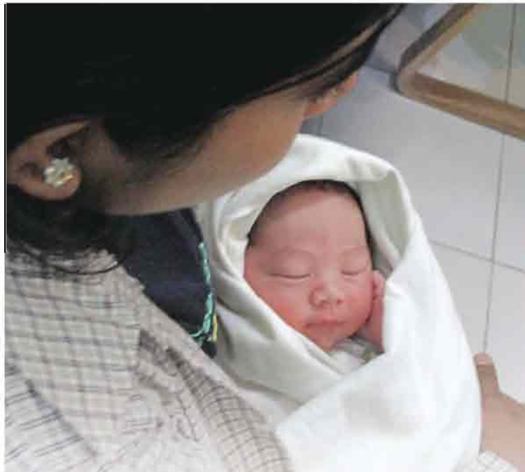
၂၀၁၁ ခုနှစ် အောက်တိုဘာလ ၃၁ ရက်နေ့၊ နံနက် ၂:၃၀ တွင် နေပြည်တော်၌မွေးဖွားခဲ့သော လူဦးရေသန်း ၇၀၀၀ ပြည့်ကလေး မောင်ကလေးမောင်အား မိခင်ရင်ခွင်၌ တွေ့ရစဉ်။

မြန်မာနိုင်ငံကုလသမဂ္ဂလူဦးရေရန်ပုံငွေအဖွဲ့ကလည်း မျိုးဆက်ပွားကျန်းမာရေးနှင့် အခွင့်အရေးဆိုင်ရာအကြောင်းကိုစပ်ဆိုထားသော တေး