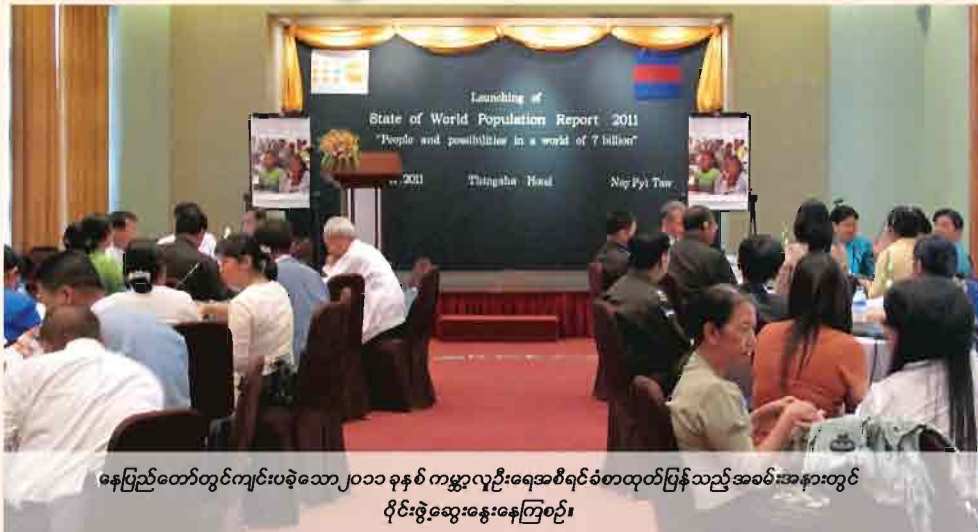
နေပြည်တော်တွင်ကျင်းပခဲ့သော ၂၀၁၁ ခုနှစ် ကမ္ဘာ့လူဦးရေအစီရင်ခံစာထုတ်ပြန်သည့်အခမ်းအနားတွင် ဝိုင်းဖွဲ့ဆွေးနွေးနေကြစဉ်။