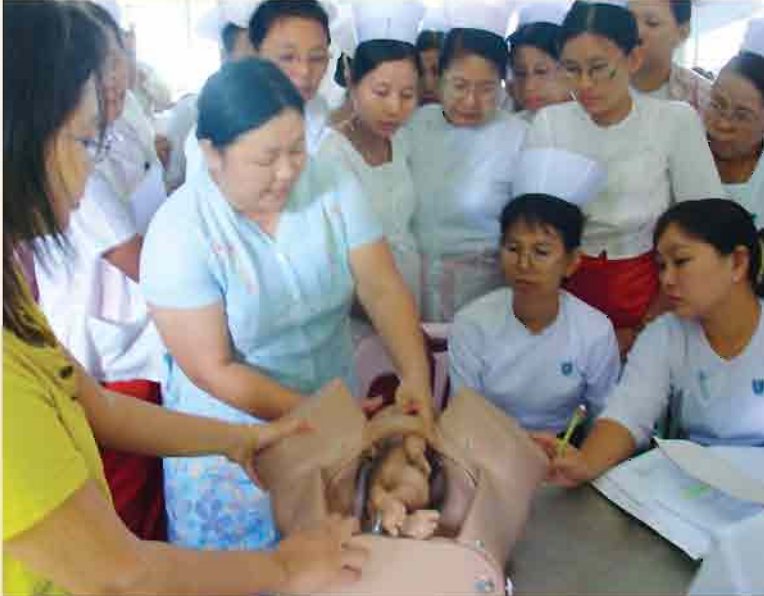
ပဲခူးတိုင်းဒေသကြီး၊ သာယာဝတီမြို့နယ်ရှိ အခြေခံကျန်းမာရေးဝန်ထမ်းများအား ကိုယ်ဝန်ဆောင်စဉ်၊ မွေးဖွားစဉ်၊ မွေးဖွားပြီးနှင့် မွေးကင်းစကလေးစောင့်ရှောက်ခြင်းဆိုင်ရာသင်တန်း ပို့ချနေစဉ်။

တက္ကသိုလ်ကျောင်းသူကျောင်းသားများကြားတွင် မျိုးဆက်ပွားကျန်းမာရေးပြဿနာများရှိနေသော်လည်း ဤစီမံချက်မျိုး ယခင်ကမရှိခဲ့ဘူးပါ။ စီမံချက်မှ လေ့ကျင့်သင်တန်းပေးထားသော သက်ရွယ်ဆင့်တူပညာပေးသူများက တက္ကသိုလ်ကျောင်းသား၊ ကျောင်းသူများအား မှန်ကန်သော ကျန်းမာရေးသတင်းအချက်အလက်များကို ဖြန့်ဝေပေးမည်ဖြစ်ပါသည်။ ထို့အပြင် လူငယ်တို့၏ တီထွင်ဖန်တီးနိုင်စွမ်းကို အသုံးပြုကာ DVD, Telephone, Hot Line နှင့် နယ်လှည့်ဖျော်ဖြေပညာပေး အဖွဲ့များမှတဆင့် ထိရောက်စွာဆက်သွယ်ပညာပေးသွားမည် ဖြစ်ပါသည်။