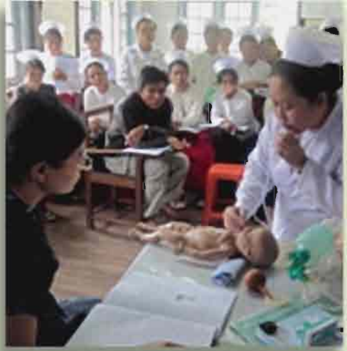
ဂျာမနီနိုင်ငံစံပုံပိုးမှုဖြင့် ကိုယ်ဝန်ဆောင်စဉ်၊ မွေးဖွားစဉ်၊ မွေးဖွားပြီးနှင့် မွေးကင်းစကလေးစောင့်ရှောက်ခြင်းဆိုင်ရာသင်တန်းကို ရှမ်းပြည်နယ် ပင်လောင်းမြို့ရှိ အခြေခံကျန်းမာရေးဝန်ထမ်းများအားပို့ချနေစဉ်။

သားဖွားဆရာမ၊ ကျောက်ပန်းတောင်းမြို့နယ်ဆေးရုံ။